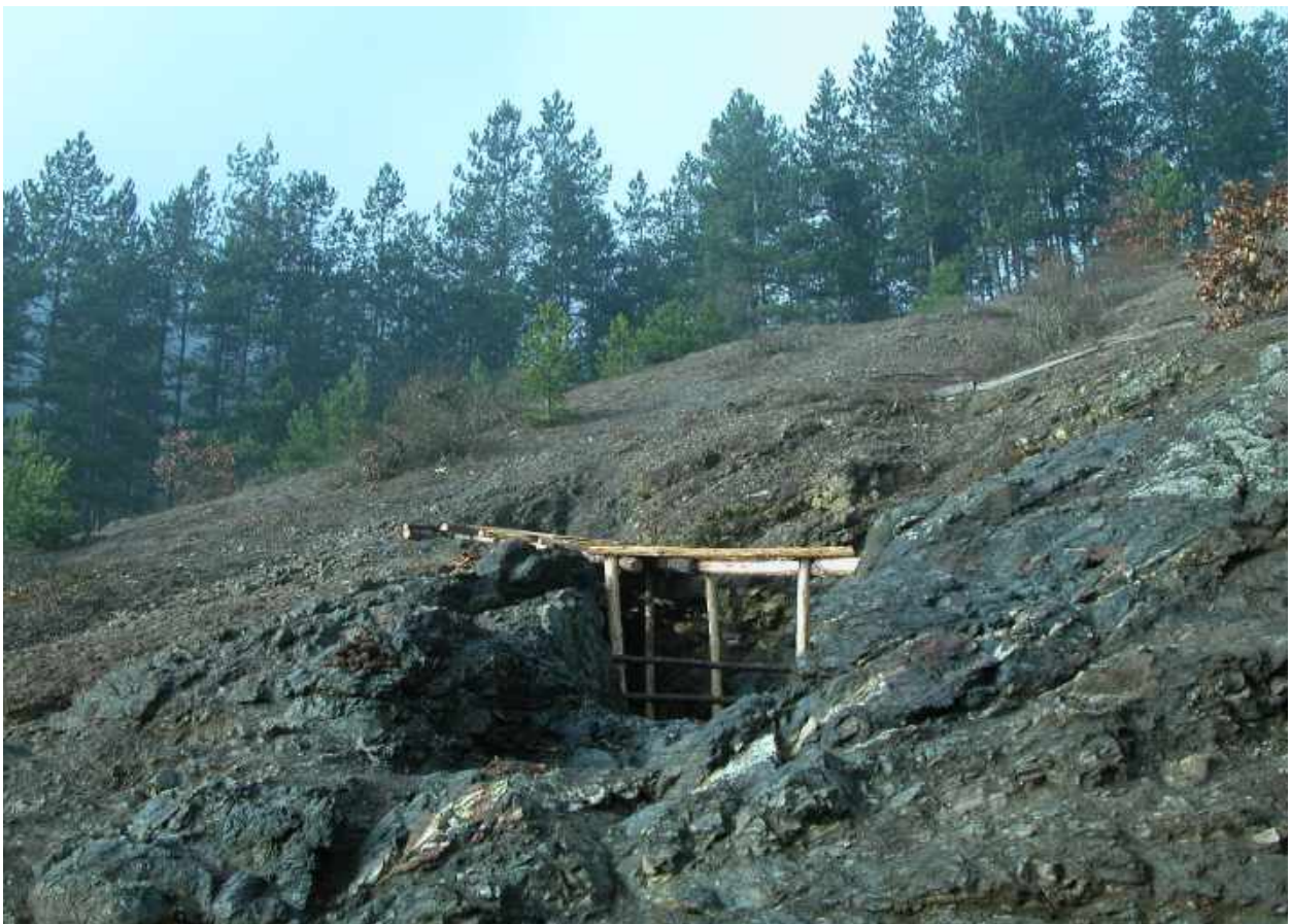
Јармовац, локалитет Мајдан, рударско окно након ископавања