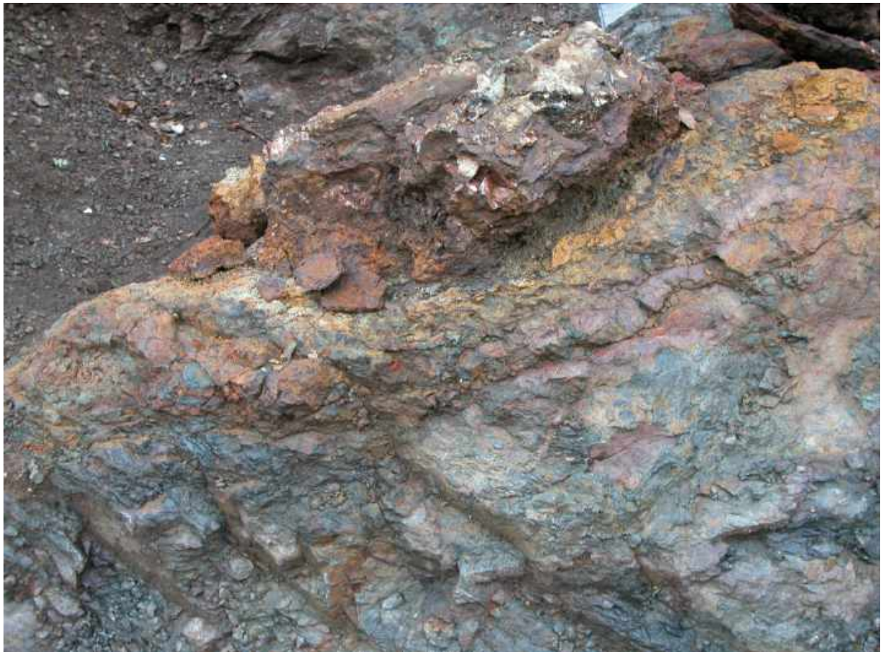
Јармовац, локалитет Цурак, тргови самородног бакра, азурит и лимонит у кварцној жици