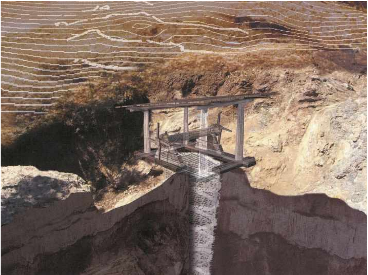
Јармовац, локалитет Цурак, рударско окно, (3D модел, В. Здравковић)