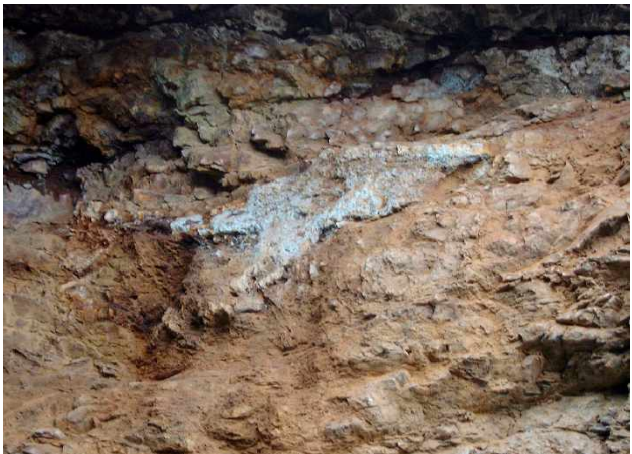
Јармовац, локалитет Мајдан, трагови руде малахита